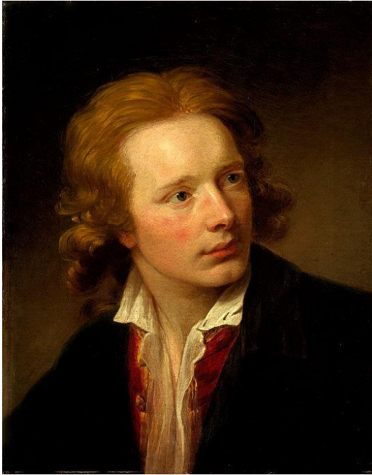
Abb. 2: David Martin, Selbstporträt , um 1760, Öl auf Leinwand, 49,5 cm x 39,4 cm, National Gallery of Scotland, 569