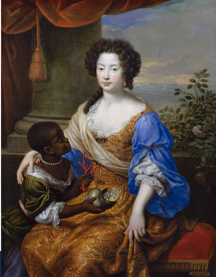
Abb. 4: Pierre Mignard, Louise de Kéroualle, Duchess of Portsmouth, with an unknown female attendant, oil on canvas, 1682, 47 ½ × 37 ½ in. (1207 × 953 mm), purchased 1878.