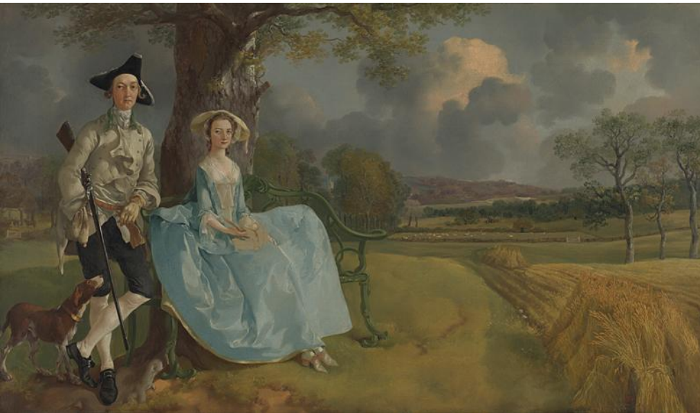
Abb. 5: Thomas Gainsborough, Mr and Mrs Andrews , oil on canvas, c. 1750, 69.8 × 119.4 cm. National Gallery, London