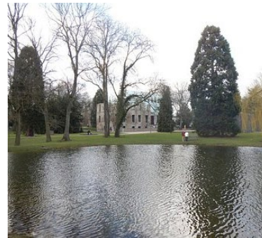
Museum unter Tage