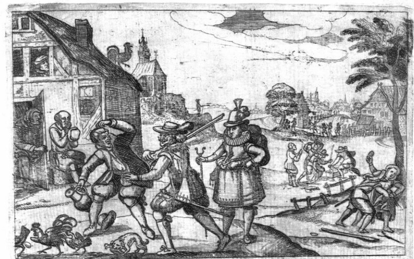
„Allgemeiner Dairer Diners Wieder die Inbarmherzige Söllhaten.“