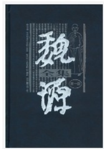
蒙雅 作者: [清] 魏源 撰