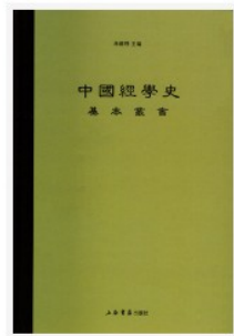
今古學考 作者: 廖平 撰