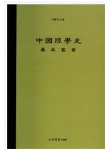
經義述聞 作者: [清] 王引之 撰