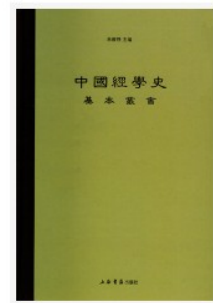
七經小傳 作者: [宋] 劉敞 撰